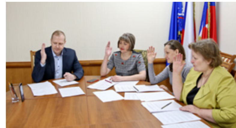
Члены ТИК Тазовского района принимают решение о регистрации кандидатов для участия в выборах

Те, кто 3 марта будут отсутствовать в районном центре, смогут проголосовать заранее. Досрочное голосование в помещении участковой избирательной комиссии по месту жительства будет проходить с 20 февраля по 1 марта включительно с 17:00 до 21:00 в рабочие дни, с 12:00 до 18:00 - в выходные дни, а 2 марта - с 12:00 до 16:00.