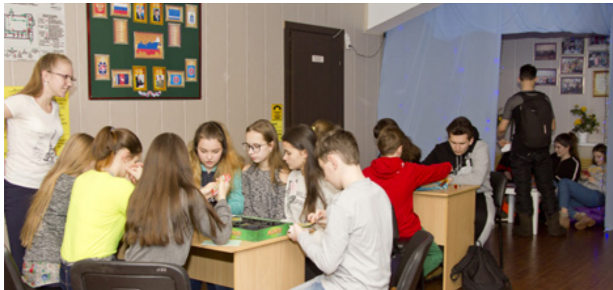
Подросткам было предложено несколько видов развлечений: настольные игры, книги, вкусный чай с пирогами, меловая доска, фотозоны и, конечно же, общение