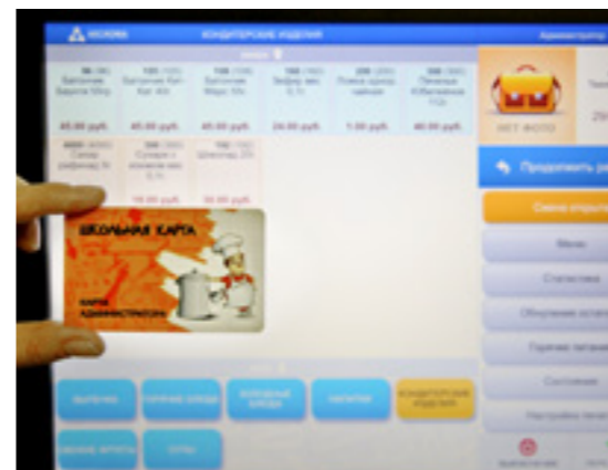
По карточке можно будет оплатить не только завтрак, но и купить выпечку и напитки в буфете

- 2 февраля у нас будет пробный день, а с 4 февраля