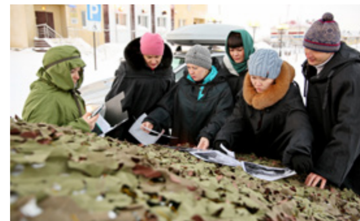
Команда «Убойная сила» проходит этап, где нужно вспомнить хронологию событий блокады

Лучше всех с заданиями квеста в итоге справилась команда местной общественной организации ветеранов боевых действий и участников локальных конфликтов Тазовского района «Ветеран», «Невский пятак» стал вторым, третье место у команды «Т-34».