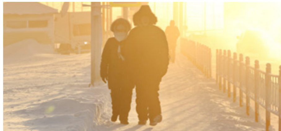
До 3 февраля во всех районах Ямала ожидается понижение температуры

Полугодовой комплект из 52 номеров стоит 286 рублей! Будьте в курсе событий, читайте «Советское Заполярье»!