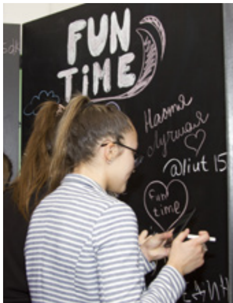
Меловая доска к середине вечера превратилась в отличную фотозону