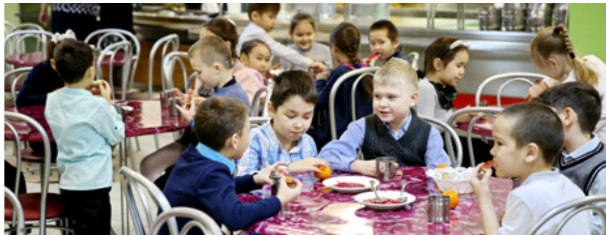
Для всех учеников начального звена Тазовской и Газ-Салинской средних школ питание останется бесплатным

Питание. В начале февраля два общеобразовательных учреждения района переходят на платное питание. В прошлом номере мы рассказали о том, как к этому событию готовятся в Газ-Салинской средней школе, сегодня - репортаж из Тазовской средней школы